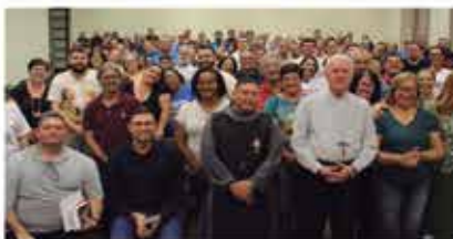
Assembleia Arq. de Pastoral: Dom Orlando participou de todas as Assembleias.