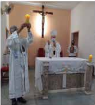
Criação da Paróquia Santa Luzia, em Guaratinguetá. 23/09/2021