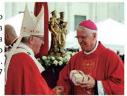
Papa Francisco entrega o Palio a Dom Orlando, na Praça de São Pedro, Vaticano. 29/06/2017