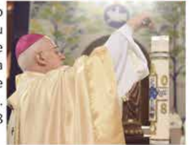
Dom Orlando no Jubileu dos 60 anos de criação da Arquidiocese de Aparecida. 2018