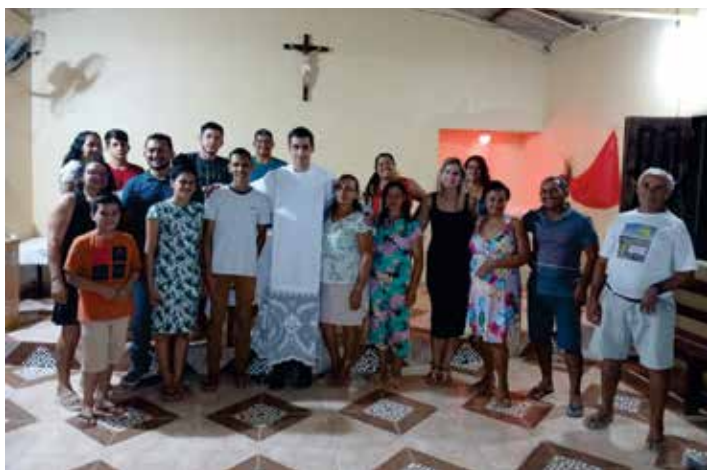
Comunidade São Tomé