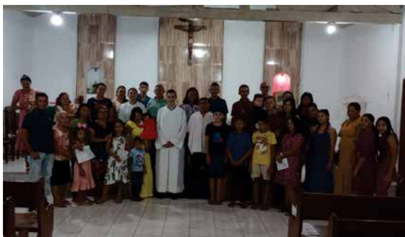
Comunidade São Raimundo Nonato - Água Fria I