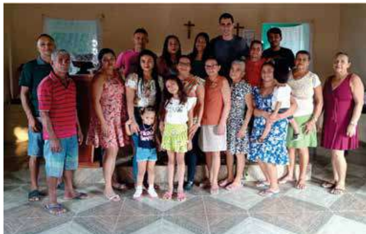
Comunidade Sagrado Coração de Jesus - Castanhal dos Cavaqueiros