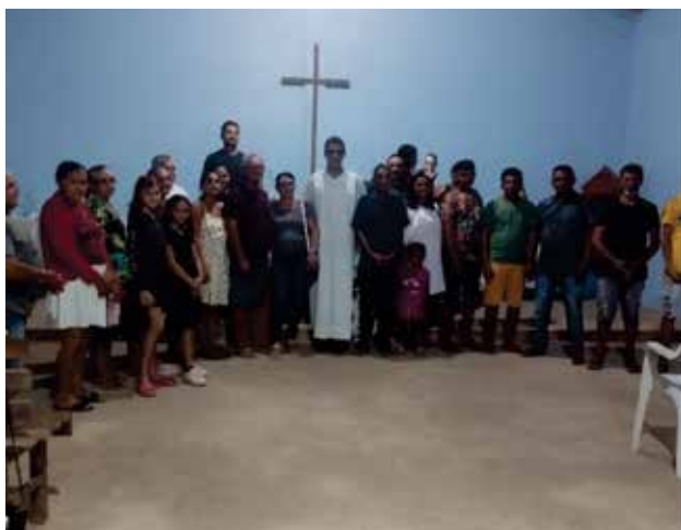
Comunidade Santa Luzia- Brilhosa